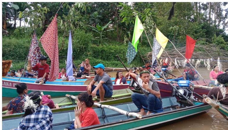
Gambar 4. Hiasan perahu masyarakat Aoheng

Tarian bersama ini adalah bagian akhir dari acara 'parug' , masyarakat kembali ke rumah mereka masing-masing. Selanjutnya, berselang dua atau tiga hari, para tetua adat mengadakan musyawarah menentukan hari untuk acara tahun baru Aoheng, yang dalam tradisi mereka disebut 'Malli' . Acara 'malli' ini dilakukan bersama seluruh masyarakat di lamin adat, biasanya seminggu setelah acara syukur panen. Setelah selesai acara tahun baru Aoheng, barulah masyarakat dapat membuat acara syukuran di rumah mereka masing-masing. Dengan demikian upacara syukur panen telah selesai dan masyarakat kembali beraktivitas seperti biasanya, terutama melanjutkan pekerjaan memanen padi di ladang mereka masing-masing, baik perorangan maupun dengan cara bergotong royong.