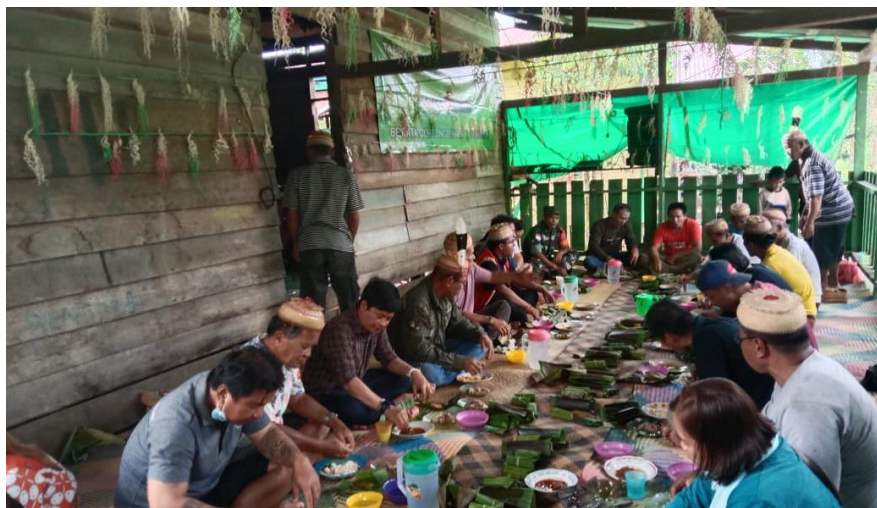
Gambar 2. Masyarakat makan bersama usai memanen padi

Sesudah ritual adat dan upacara keagamaan dilakukan, masyarakat dipersilahkan memanen padi pertama mereka di ladang kepala adat. Masing-masing masyarakat memanen padi secukupnya, sebagai syarat ritual panen padi, yang dalam tradisi masyarakat Aoheng di sebut ‘tucuq,’ yang berarti ‘santap’. Usai memanen padi, seluruh masyarakat berkumpul di pondok ladang untuk makan bersama sebagai bentuk kebersamaan dan ungkapan syukur atas panen pertama.