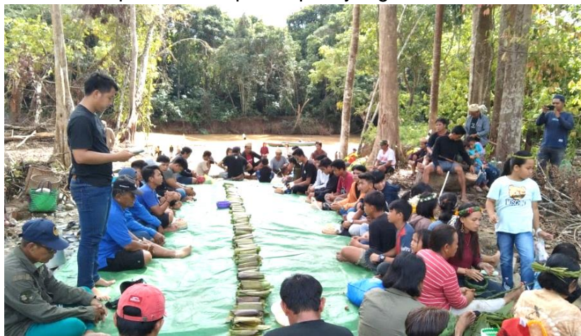
Gambar 3. Masyarakat Berdoa Bersama dalam Acara Paruq

Menurut keyakinan masyarakat Aoheng, makan bersama di alam terbuka merupakan kesempatan berkumpul bersama roh para leluhur. Selain itu, makan bersama dalam acara ' paruq ' ini merupakan tradisi makan bersama dengan alam semesta dan seluruh penghuninya. Sisa-sisa makanan juga akan dimakan oleh hewan, seperti: burung, semut, ikan, dan hewan lainnya. Hal ini diyakini bahwa alam dan seluruh makhluk ciptaan ikut merasakan, ikut bersyukur karena mendapatkan hasil panen padi yang baru.