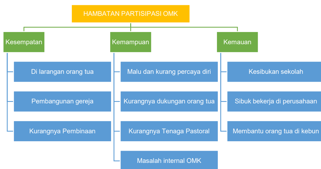
Gambar 2. Hambatan Partisipasi OMK

Hambatan-hambatan partisipasi OMK dalam perayaan Ibadat Sabda pada hari Minggu di Stasi St. Fransiskus Xaverius Kaliorang mengindikasikan bahwa OMK masih pasif dalam kegiatan organisasi mereka. Namun demikian, pendampingan OMK sudah mulai dilakukan oleh pengurus dewan pastoral, baik di lingkup stasi maupun lingkup paroki. Mengingat bahwa Paroki St. Paulus Kaubun masih baru terbentuk sebagai paroki ±3 tahun, hal ini menjadi salah satu hambatan dalam pendampingan OMK di wilayah pastoral paroki, termasuk di stasi tempat penelitian ini dilaksanakan. Hambatan pastoral OMK adalah pendampingan bagi mereka masih bersifat pasif karena dewan pastoral paroki masih berfokus kepada anak-anak temu minggu, wanita Katolik Republik Indonesia (WKRI) dan mengurus pembangunan gereja. Pastor paroki sangat mengharapkan pengurus stasi untuk membentuk dan mengurus OMK di wilayah masing-masing, agar OMK dapat bekerja sama dalam menjalankan program-program pastoral yang telah direncanakan. Berdasarkan rangkuman hasil penelitian, berikut ini adalah hambatan-hambatan partisipasi OMK.